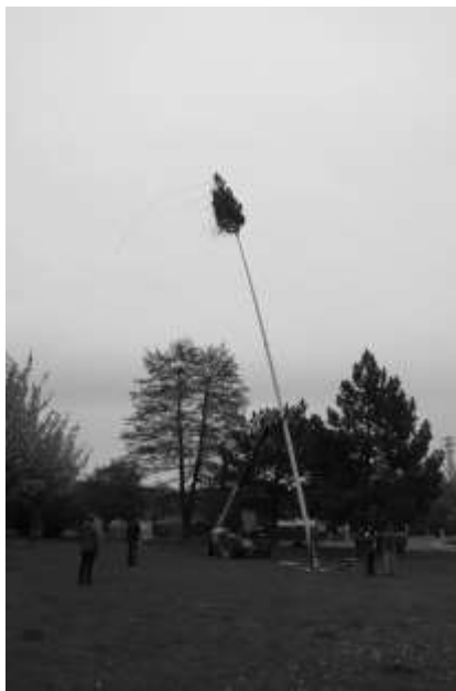
Foto: Stavění májky