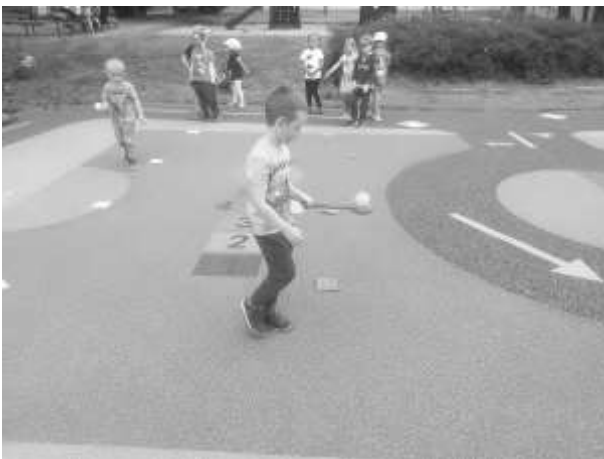
Foto: Oslava Dne dětí v mateřské škole

Obdrželi jsme 19 přihlášek, z toho 14 z Kladrub a spádových obcí a 5 z cizích obcí.