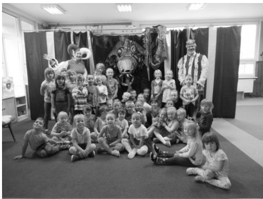
Děti z MŠ Kladruby

Po našem dlouhém potlesku jsme se s drakem i vyfotili a to už se nebál opravdu nikdo.